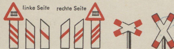
linke Seite rechte Seite 240 m 160 m 80 m 80 m 160 m 240 m Baken vor beschränktem Bahnübergang Eingleisiger Bahnübergang ohne Schranken