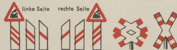
linke Seite rechte Seite 240 m 160 m 80 m 80 m 160 m 240 m Baken vor unbeschränktem Bahnübergang Mehrgleisiger Bahnübergang ohne Schranken