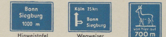
Hinweistafel vor Anschlussstelle Wegweiser an Anschlussstelle Hinweis auf Wildwechsel